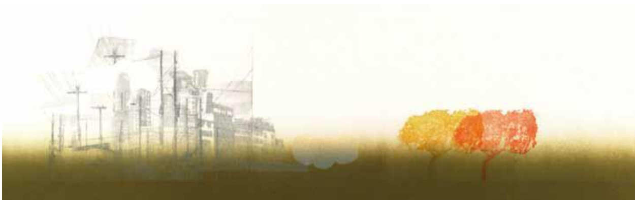
Emmanuelle Giora, Paysage urbain , N.3, 2006, eau-forte sur papier

Dans Souvenirs from , une série de neuf sérigraphies, réalisées lors d'une résidence d'artistes aux Etats-Unis dans l'Etat de New-York (2012), elle se réapproprie des cartes postales trouvées dans une brocante. L'image de ces paysages américains idéalisés est transformée et agrandie. L'artiste y inscrit du texte puisé dans les gros titres du New-York Times. Ainsi la carte postale perd de son intimité, en narrant un événement médiatique et devient soudainement 'universelle'.