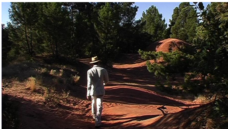
Pierre SOIGNON, Les Oracles-Les Demoiselles Coiffées , 2012, vidéo pal, 16:9, couleur, son

Cet artiste explique : 'Au travers de photographies, films Super 8 et vidéos, je cherche mon chemin entre villes, champs et forêts. Dans le fantasme d'un Grand Tour , d'un chemin initiatique à parcourir en compagnie d'un personnage, un double'.