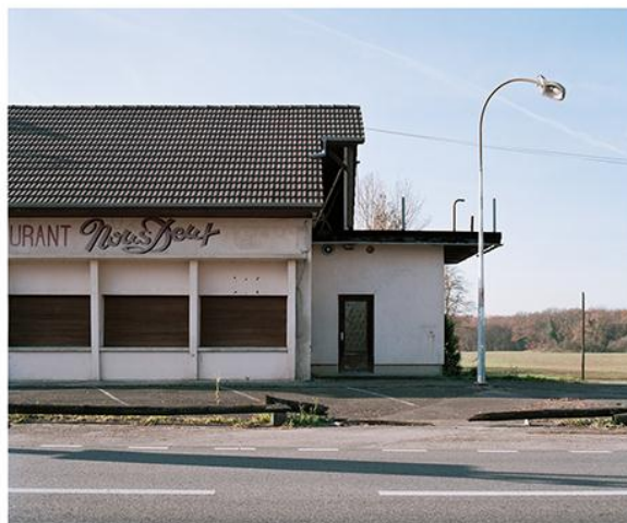
Camille ROUX, Route 66 , 2012, photographie